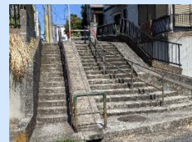
▲当センターに続く階段階段を使って筋力アップ！