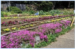
▲地元の方々が手入れした鮮やかな花畑は気持ちを和ませてくれます。