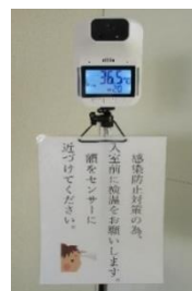
▲額を近づけて検温

感染防止対策に多くのご支援を頂き、備品等を準備させていただきました。ありがとうございました。