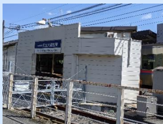
▲京成大和田駅北側の改札口電車でお越しの際はこちらから。