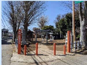
▲時平神社です。毎年、正月に初詣に行きます。