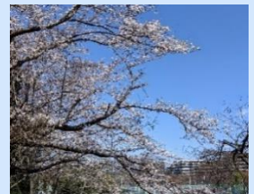
▲八千代総合運動公園春は桜が満開です！新川沿いはウォーキングに最適です。