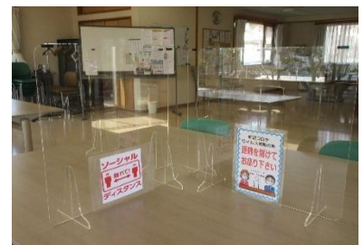
▲透明の衝立で感染防止